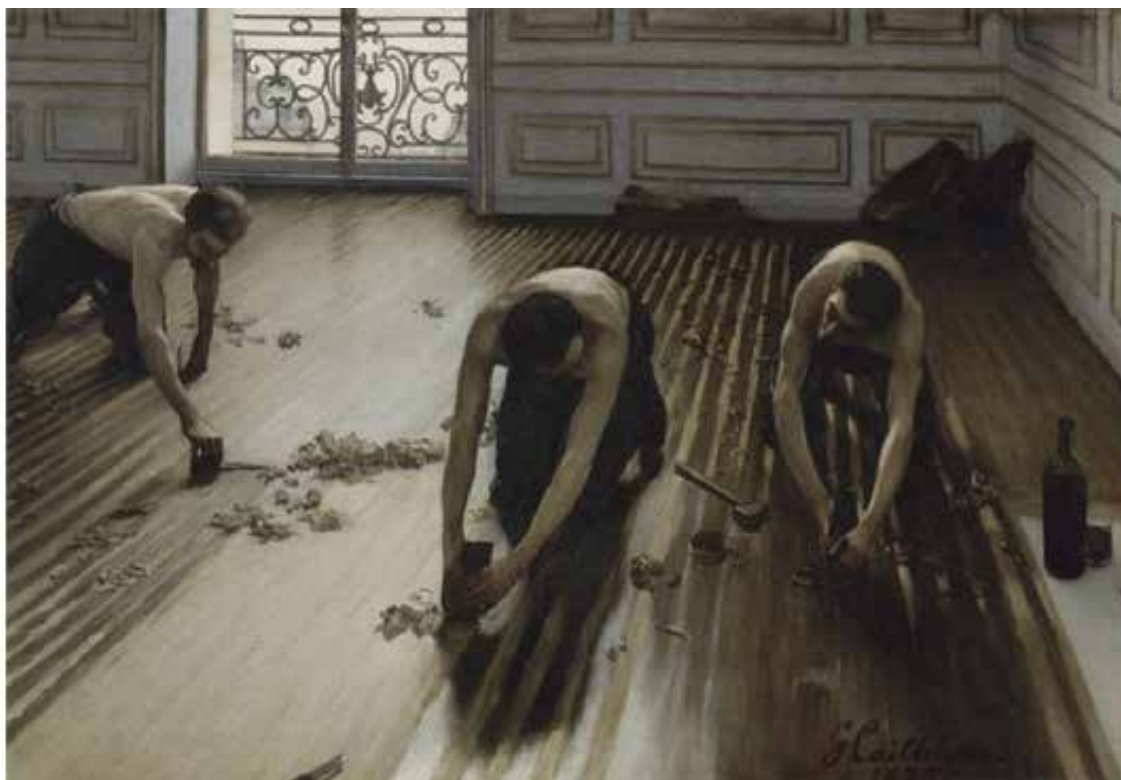
Les raboteurs de parquet, 1875, huile sur toile Musée d'Orsay, Paris

* Antoinette propose une deuxième visite à 15h15 si le nombre de participants dépasse la limite de 50 personnes.